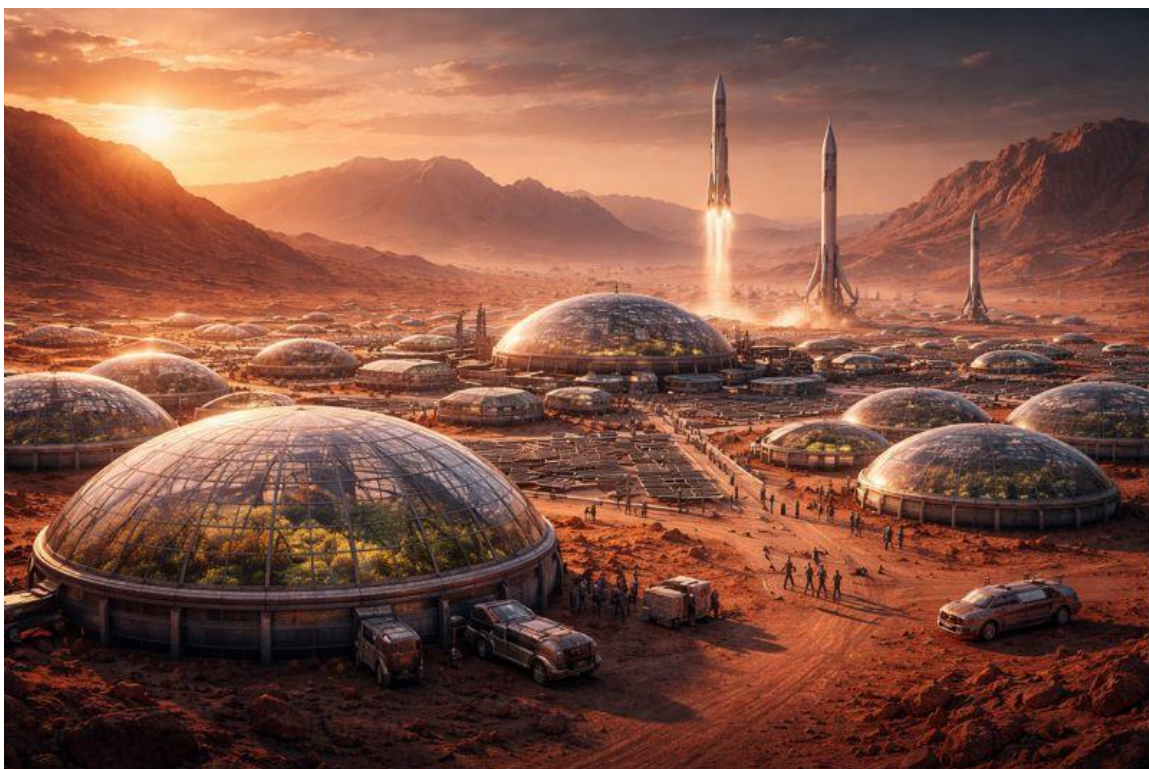
Cité martienne imaginée par une I.A.

Or ces vaisseaux sont censés être capables d'emmener cent personnes sur Mars. Deux millions de dollars divisés par cent, cela fait vingt mille dollars par personne. C'est beaucoup pour un billet d'avion, mais c'est en fait beaucoup moins que ce qu'il en coûtait aux immigrants, par rapport à leurs revenus de l'époque, pour faire le voyage en bateau d'Europe en Amérique dans les années 1700 ou même dans les années 1800.