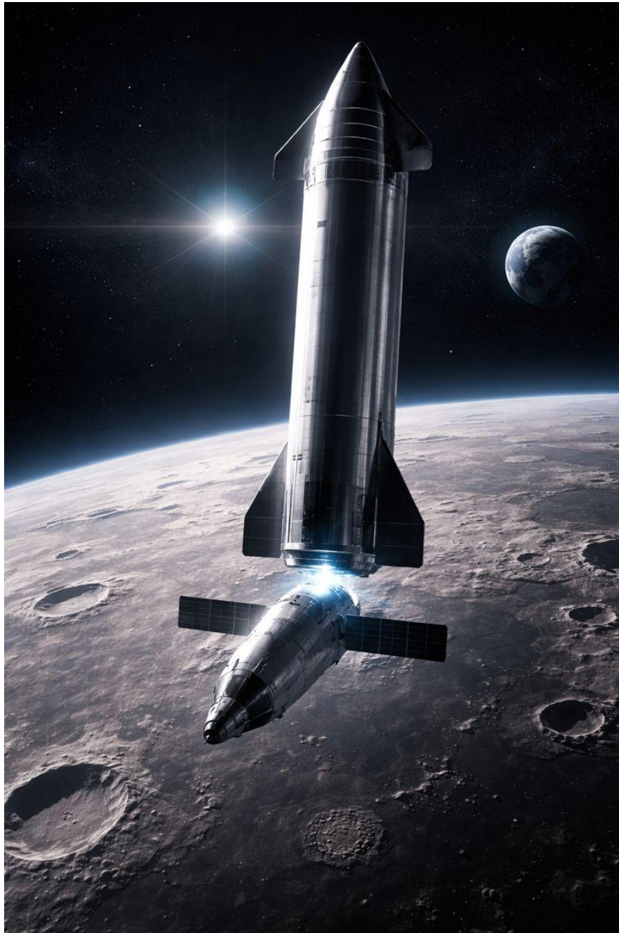
Starboat ravitaillé par un starship en orbite lunaire, image générée par IA.

nous n'avons pas besoin de station lunaire Lunar Gateway ? Nous avons besoin d'un Starship, à condition d'avoir aussi un Starboat. Nous pouvons y arriver.