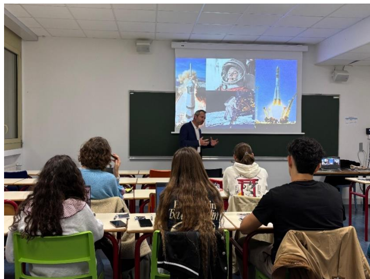
Figure 2 : rencontre entre étudiant et Way4Space dans le cadre de l'UER A-Space, ©Way4Space

Dès la Licence 3, des unités d'enseignement "Recherche-Projet" introduisent les bases de la biologie spatiale et des environnements extrêmes, à travers des approches expérimentales et interdisciplinaires. Ces enseignements se développent dans chaque université partenaire, et par exemple à Bordeaux un enseignement optionnel de 50 heures (UER A-Space) a été mis en place pour les étudiants.es en santé (médecine odontologie, pharmacie, maïeutique...).