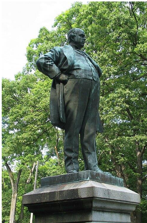
Statue de Robert Ingersoll. Photographer: John DoddL Sculptor: Frederick Triebel (1865–1944), CC BY 2.5

« Très bien », dit-il, « mais alors d'où viennent les machines ? Elles viennent de la liberté. C'est la liberté de penser qui nous a permis de les construire. C'est la liberté de penser qui a créé les machines. Donc la liberté nous donne les machines, les machines nous apportent la liberté. » Voilà ce qu'a dit Ingersoll. Et il a employé cet argument dans de nombreux autres discours.